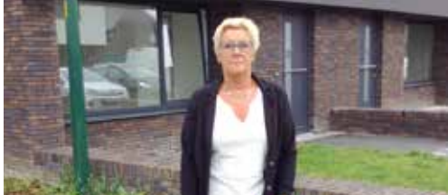
Nederlands verplicht voor sociale huurders p.2