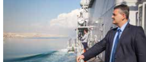
Minister Vandeput komt naar Blankenberge p.3