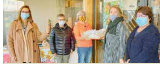
Week van de kinderbegeleider (p.3)