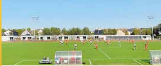
Extra Vlaamse subsidies voor verenigingen (p.2)