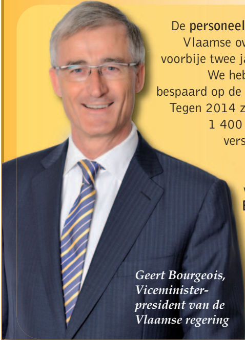
Geert Bourgeois, Viceminister- president van de Vlaamse regering

De personeelsbudgetten van de Vlaamse overheid daalden de voorbije twee jaar met 5 procent. We hebben ook drastisch bespaard op de werkingsmiddelen. Tegen 2014 zullen er bovendien 1 400 ambtenaren op de verschillende Vlaamse departementen niet stelselmatig vervangen worden. Een besparing van 50 miljoen euro per jaar!