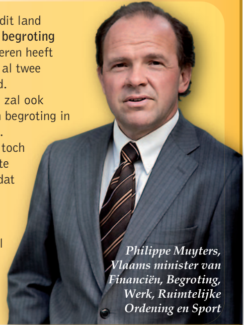
Philippe Muylers, Vlaams minister van Financiën, Begroting, Werk, Ruimtelijke Ordening en Sport

Als enige overheid in dit land heeft Vlaanderen een begroting in evenwicht. Vlaanderen heeft de voorbije twee jaar al twee miljard euro bespaard. De Vlaamse Regering zal ook de volgende jaren een begroting in evenwicht voorleggen. Als er geleidelijk aan toch wat budgettaire ruimte komt, investeren we dat zoals Europa vraagt: in onze economie (O&O, infrastructuur, werk ...) en in sociaal beleid (kinderopvang, wachtlijsten gehandicapten, kindpremie ...).