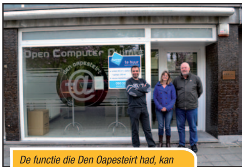
De functie die Den Oapesteirt had, kan bijvoorbeeld plaatsvinden in De Bollaard.

Het gerucht doet de ronde dat de dienstverlening in Den Oapesteirt definitief zou stopgezet worden wegens budgettaire redenen. Ondertussen is het lokaal bijna gesloten. In navolging van 'het velokot' is de huur opgezegd. De N-VA er is grote voorstander van om de mogelijkheid te onderzoeken om het computerlokaal opnieuw te openen. Maar dan geïntegreerd in De Bollaard.