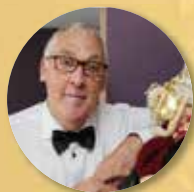
Fons Monte Schepen van Toerisme, Cultuur en Communicatie, Erfgoed, Evenementen

Kwaliteitsvol en betaalbaar wonen is en blijft een aandachtspunt in onze stad. Hier verder op inzetten zal er voor zorgen dat ook jonge gezinnen zullen kiezen voor onze stad. Zo maken we samen een leefbaar Blankenberge.